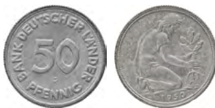
ex Los 3234