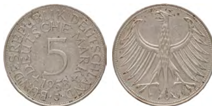
ex Los 3214