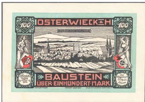
ex Los 3346