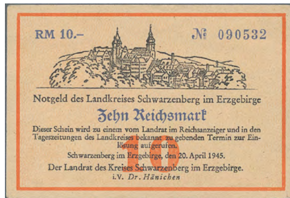
ex Los 3334