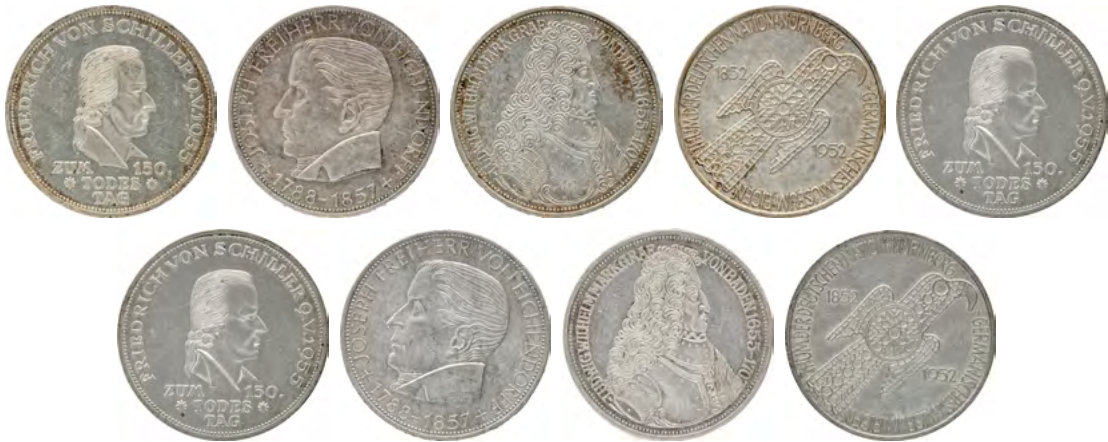
ex Los 3213