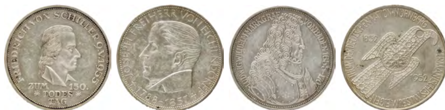
ex Los 3228